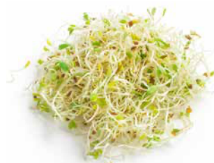
Groddar & skott