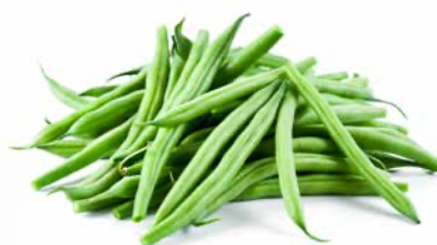
Bönor & ärtor