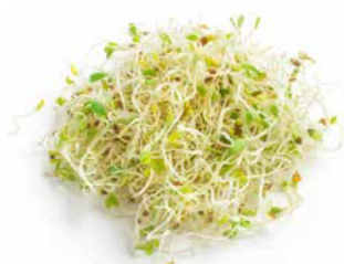
Groddar & skott