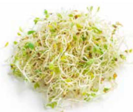
Groddar & skott