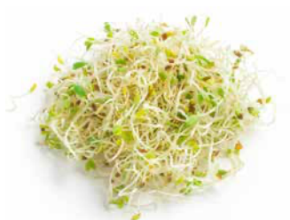
Groddar & skott