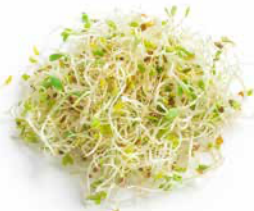
Groddar & skott