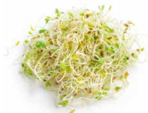
Groddar & skott