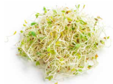
Groddar & skott